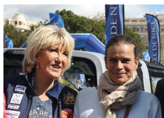
Son Altesse Sérénissime La Princesse Stéphanie de Monaco