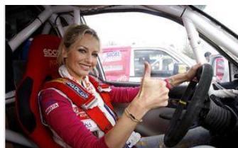
Adriana Karembeu Gazelle et Ambassadrice durant 3 ans