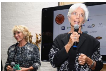
Madame Christine Lagarde Présidente du FMI. Soirée à New York en 2016 et à Paris en 2017.