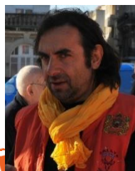
André Manoukian Parrain et présentateur du programme M6 en 2012 et 2013