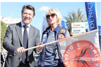
Monsieur Christian Estrosi Maire de Nice, Président de la métropole Président délégué de la région Provence- Alpes-Côte d'Azur.