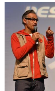
Paul Belmondo Réalisateur du film « The Gazelles » l'esprit Pionnier