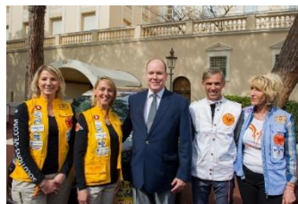
Son Altesse Sérénissime Le Prince Albert II de Monaco