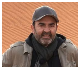
Bruno Solo Parrain et présentateur du programme court M6 2014 et 2017